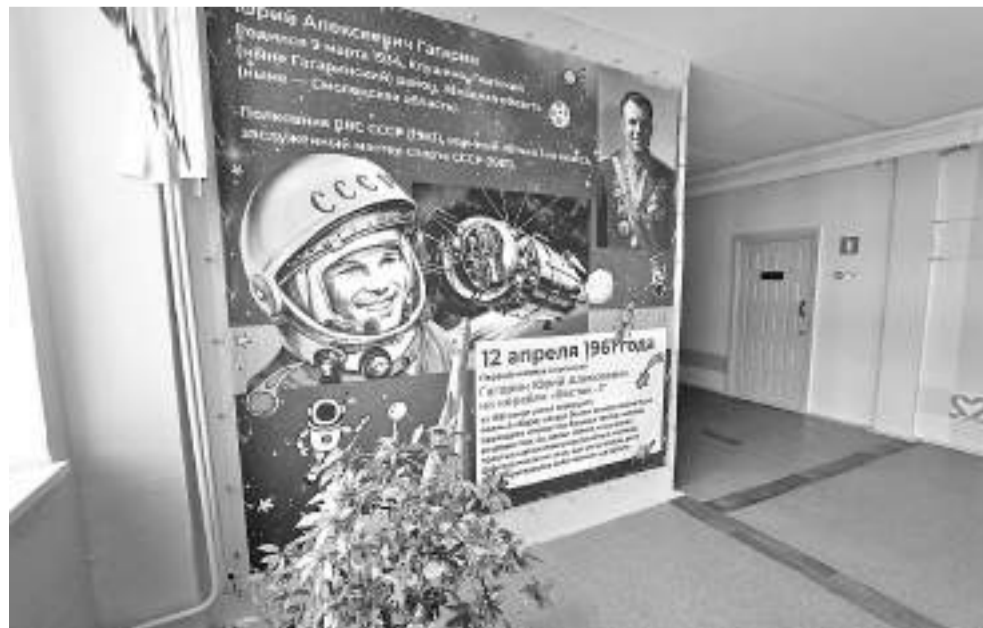
В гимназии № 22 даже стены учат