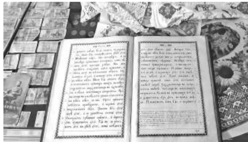
Экспонаты музея Прелестненской школы

ДЛЯ НАШИХ КАДЕТ МЫ РАЗРАБОТАЛИ СВОЙ КУРС ИСТОРИИ, НАЧИНАЯ С ПЕРВОГО КЛАССА. ОН СОДЕРЖИТ В СЕБЕ НЕСКОЛЬКО РАЗДЕЛОВ: ПЕРВЫЙ КЛАСС — ИСТОРИЯ МОЕЙ СЕМЬИ; ВТОРОЙ КЛАСС — ИСТОРИЯ МОЕГО СЕЛА; ТРЕТИЙ КЛАСС — ИСТОРИЯ МОЕГО РАЙОНА; ЧЕТВЁРТЫЙ КЛАСС — ИСТОРИЯ МОЕЙ ОБЛАСТИ. ЭТО НЕ ПРОСТО ЗАНЯТИЯ ЗА ПАРТОЙ — ЭТО АРХЕОЛОГИЧЕСКИЕ ЭКСПЕДИЦИИ, ПОХОДЫ, РАБОТА В ШКОЛЬНОМ МУЗЕЕ.