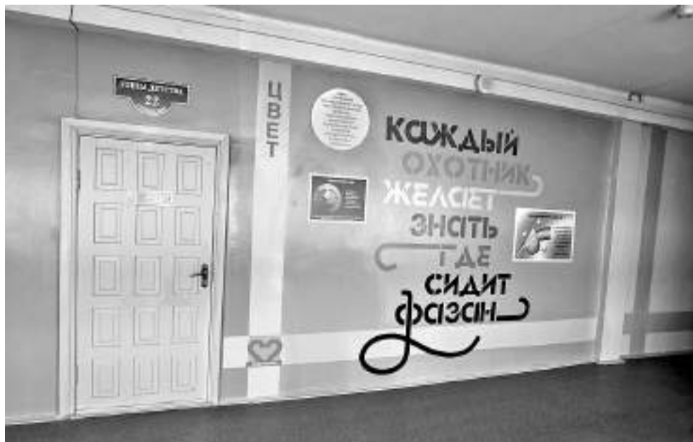
На улице Детства гимназисты могут узнать немало интересных фактов о радуге