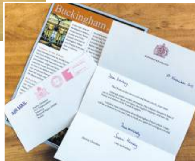
Письмо от королевы Великобритании