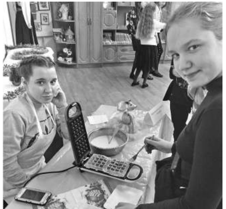
Декабрь 2019 года. На новогодней ярмарке школьники пекли венские вафли