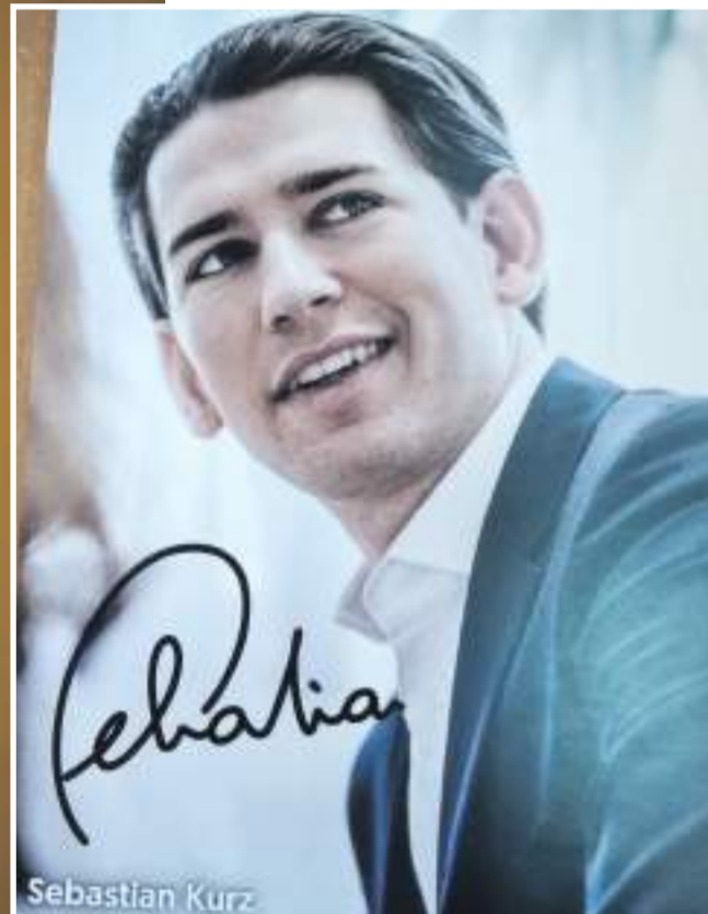
Фотография с автографом от канцлера Австрии Себастьяна Курца

Тогда он изучал историю. Узнавал, как обращались к царям и королям в России и за границей. Оказывается, первым появилось обращение Madam (мадам), потом пришло Her Majesty (Её Величество), а у нас использовалось обращение «Ваше императорское величество».