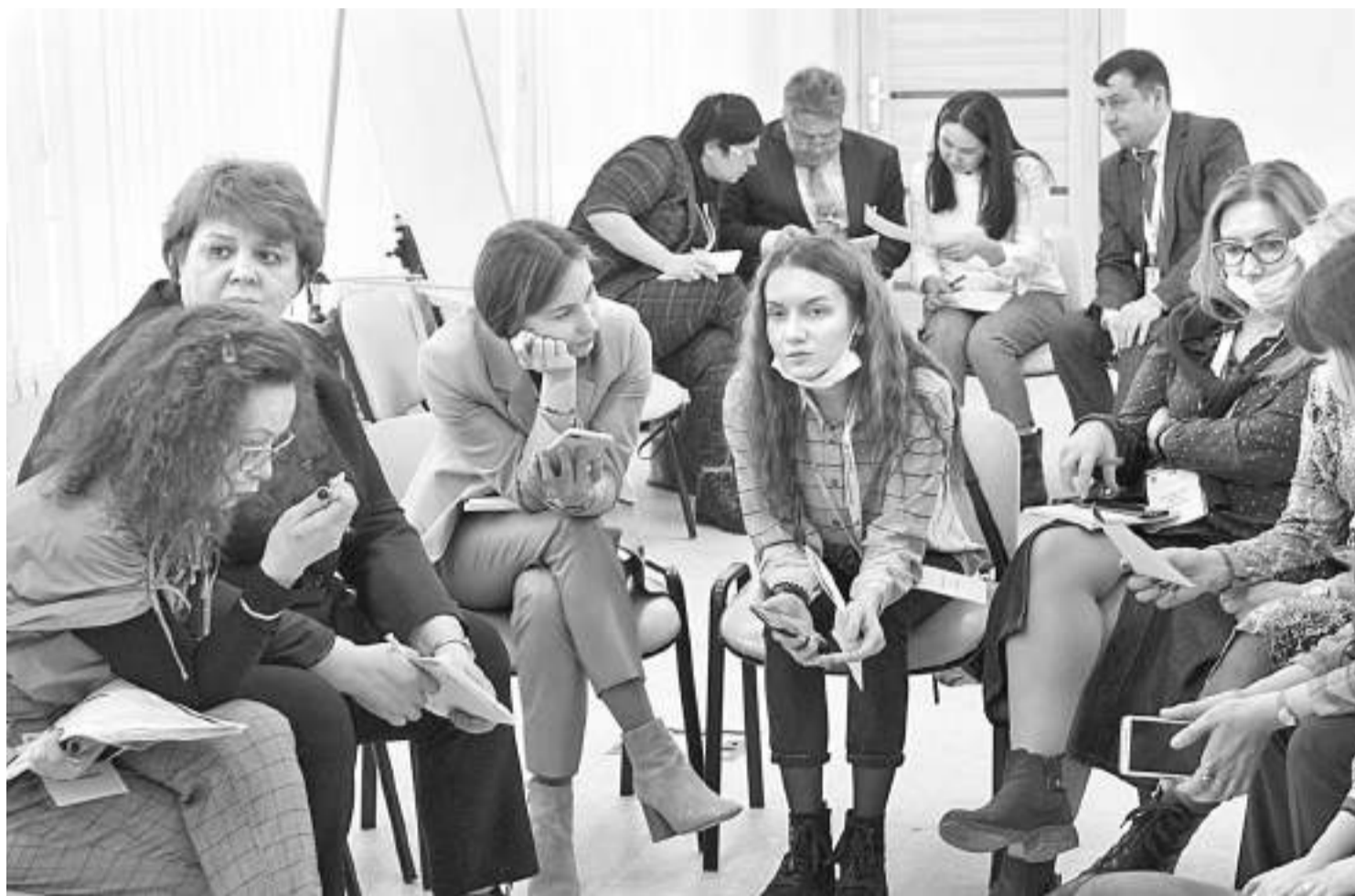
Во время дискуссии

КАК ОПЫТ КОЛЛЕГ ПОБУЖДАЕТ МЫСЛИТЬ И ДЕЙСТВОВАТЬ